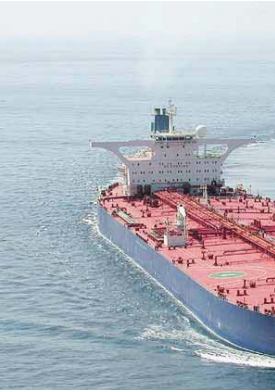
نقل نفط عملاقة في طريقها الأسواق العالمية (اليوم)