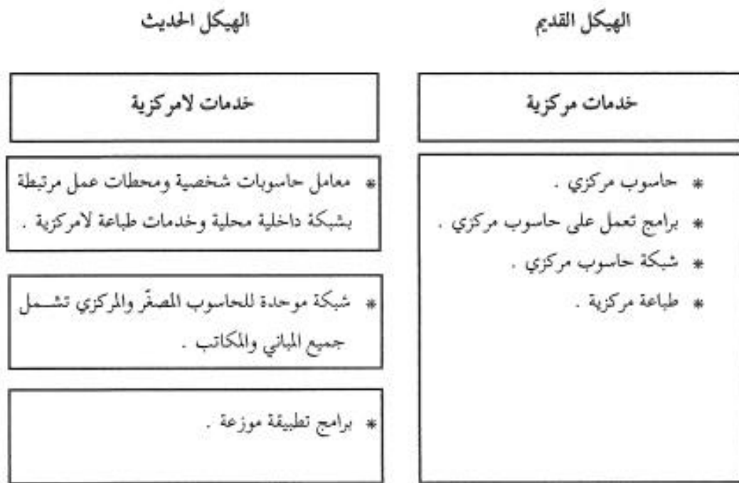
الشكل رقم (٢)

ويوضح الشكل التالي هذا التغير في هيكل تقديم الخدمات الأكاديمية بالجامعة .