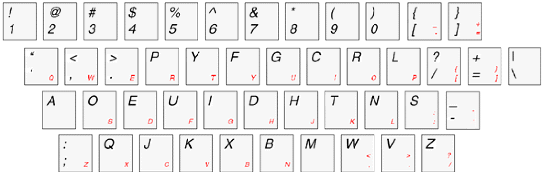
Dvorak Keyboard Layout