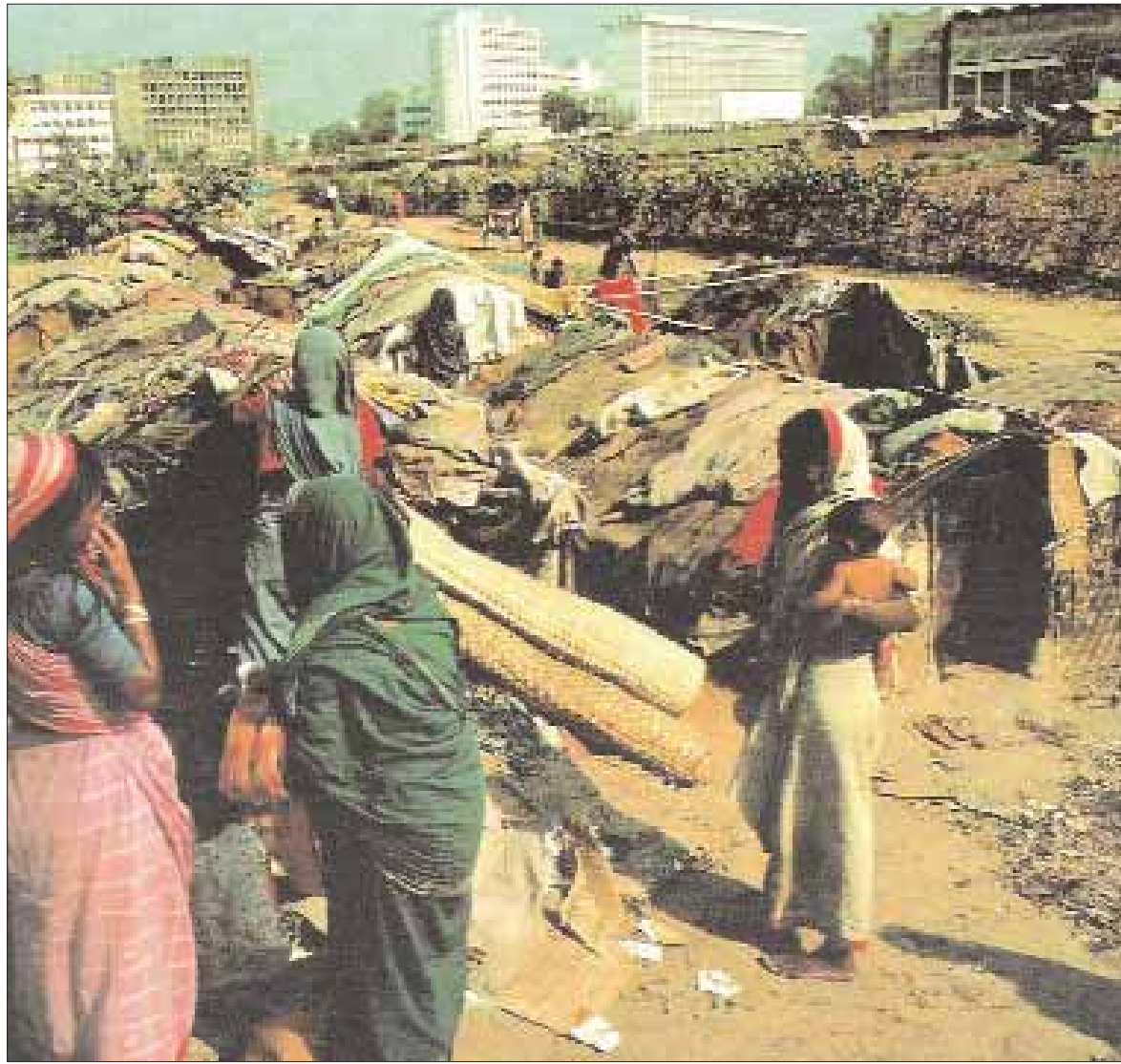
أحياء عشوائية في قلب مدينة بومباي بالهند

والمحلية لديها القدرة على تكوين منظومتها الإجتماعية وتكوين فئاتها المجتمعية المصغرة وجذبا ولا يمكن تحقيق ذلك اصطناعيا بل بمنهجية وآلية طبيعية.