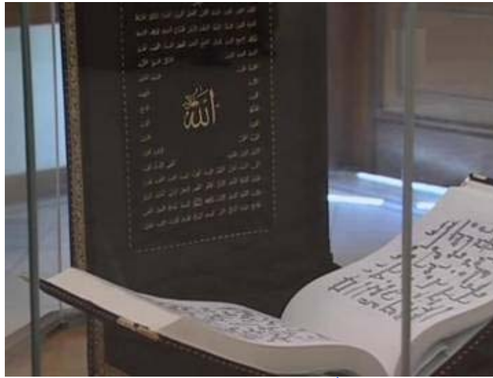
قاعة المسجد النبوي الشريف

وفيها احد الابواب الرئيسية للمسجد النبوي الشريف ويعود تاريخه للتوسعة السعودية الاولى عام 1337هـ