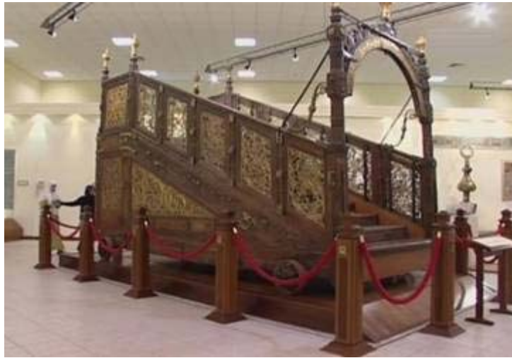
وهذه المقصورة التي كانت تغطي مقام ابراهيم عليه السلام قبل استبدالها في عهد خادم الحرمين الشريفين الملك فهد بن عبدالعزيز رحمه الله