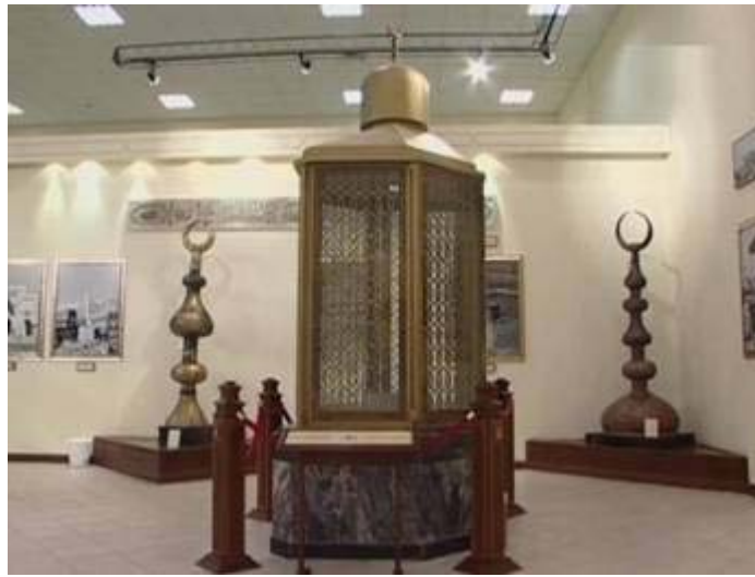
وهذه عدد من اهلة المنابر التي يعود تاريخها لعام 1299هـ